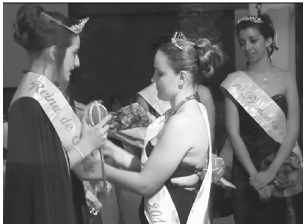
FOTOS: Reinas El Talar en 39 fotos en el álbum Eleccion Reina "El Talar 2012" de AVGproducciones. https://www.facebook.com/pages/AVGproducciones/124284754342323 https://www.facebook.com/reinas.eltalar?fref=ts