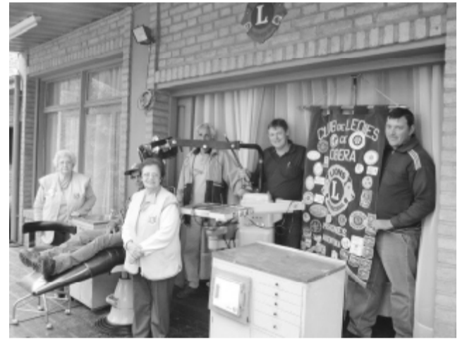
Donación de Consultorio Odontológico a Campo Ramón