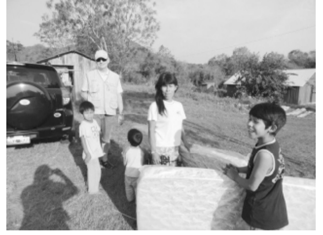
Entrega de colchones a Comunidad Mbya de Cuña Pirú

Las Heras 1679 (esquina Kennedy) El Talar