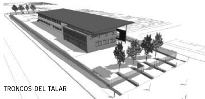
TRONCOS DEL TALAR

Para solucionar este problema, la actual gestión municipal construirá un edificio propio para la ESB Nº 13, en un predio ubicado en Gorriti y Jaquet, que quedará emplazado a la plaza Güemes. Es que hoy esta escuela comparte espacio con la primaria Nº 5. Es que hoy solamente se puede cursar hasta tercer año y el