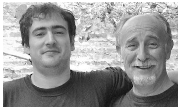
Sociales: Sigue en la página 10