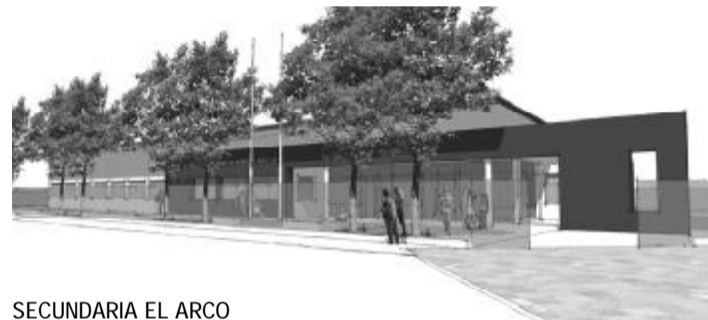
SECUNDARIA EL ARCO

cuarto en turno vespertino, con lo cual los jóvenes deben migrar hacia otros establecimientos.