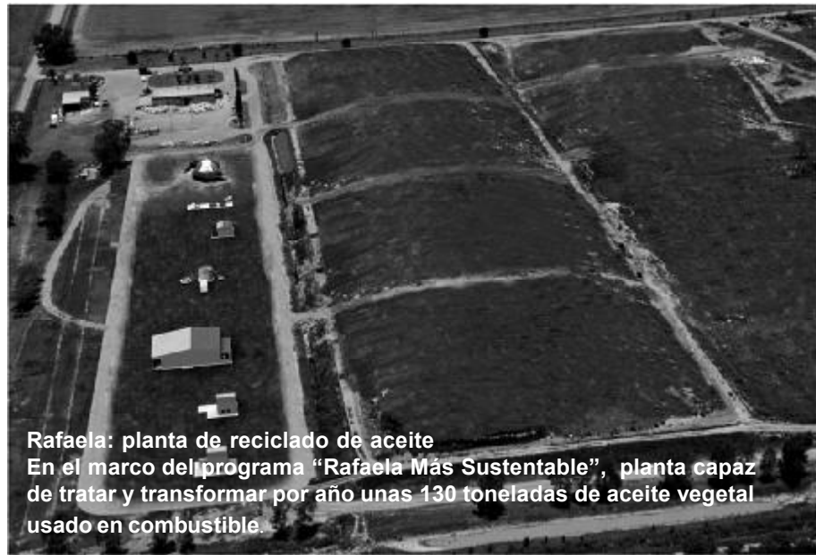
Rafaela: planta de reciclado de aceite En el marco del programa "Rafaela Más Sustentable", planta capaz de tratar y transformar por año unas 130 toneladas de aceite vegetal usado en combustible.

amplia zona de energía solar, otra de producción de comida y energía, una que aproveche la energía del mar, y otra con una planta de reciclado de agua. Toda la movilidad será peatonal, por ciclovías o en autos eléctricos ecológicos con piloto automático. Todos los edificios estarán equipados para poder cultivar alimentos. No solo se producirá comida en los espacios del distrito dedicados a ello, sino también en los techos de los edificios. La zona tendrá unas 80 hectáreas y allí podrán vivir entre 15 y 22 mil personas.