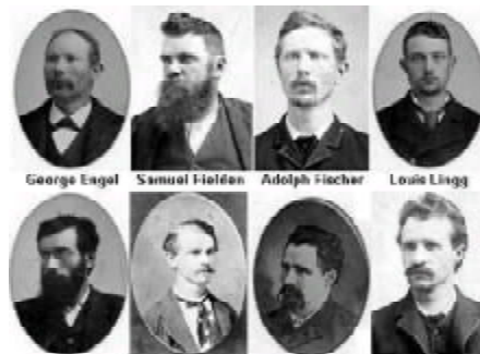
George Engel Samuel Fielden Adolph Fischer Louis Lingg Michael Schwab Albert Parsons Oscar Neebe August Spies

En nuestro país el 1º de mayo es feriado nacional por la