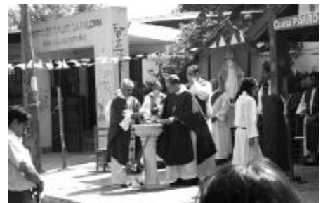
13 de diciembre del 2009, la Cuasi Parroquia Espiritu Santo pasa a ser Parroquia

Etn: Nosotros agregamos que quien recibe el préstamo de algún pedido, este elemento debe ser cuidado y devuelto, no ya como agradecimiento al club, sino porque ese elemento podrá servir a otro vecino que lo esté necesitando.