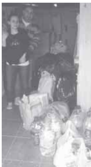
Los alumnos del centro de estudiantes del I.S.F.T. N°199 colaboraron con los afectados por las inundaciones. Es parte de la tarea que diariamente realizan en el Instituto.