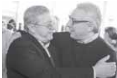
Foto de los directores de educación con el Intendente en el 80º Aniversario de El Talar