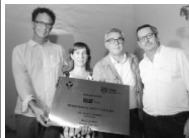
sigue en la página 3

URRA es un proyecto argentino sin fines de lucro fundado en 2010, que realiza Residencias de Arte e Intercambios Culturales. Pertenecen a la Fundación VERIA para el