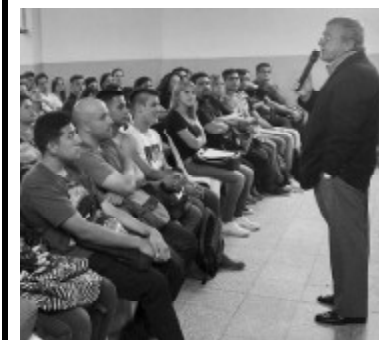
sigue en la página 4

Una comunidad estudiantil y docente que bregan por su edificio propio