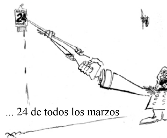
... 24 de todos los marzos

La pretendida teoría de los dos demonios no impide entender que la guerrilla imaginaba una confrontación con un apoyo popular que jamás tuvo. Lo peor de la entrega de tantas vidas es lo estéril de ese gesto desde la nula posibilidad de lograr el triunfo que había instalado como su único objetivo. Y luego, entender que no tuvimos una dirigencia guerrillera que pudiera explicar la coherencia de sus objetivos en el retorno a la democracia. Los hermanos uruguayos tienen autocrítica y éxito político; su guerrilla, que sufrió la cárcel, fue capaz de interpretar a las mayorías populares. Nosotros no podemos seguir transfiriendo culpas, la violencia en democracia fue suicida al margen de la debilidad de esa democracia, o más aún, en el marco de su debilidad. El golpe fue el resultado