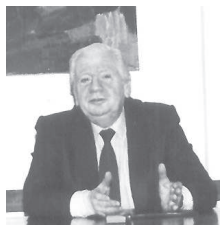
Escrito por el profesor Walter Mársico, en la edición N° 8 de julio de 1999

Pero lo que nadie ignora es que ellos fueron los ilustres padres de la República Argentina y los verdaderos autores de la Independencia.