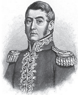
José de San Martín

¿Estamos convencidos y animados a continuar por ese camino? Los ilustres padres de la República Argentina