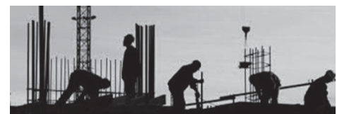
Día del comerciante de materiales para la construcción

26 de Septiembre: "Día del Comerciante de Materiales de Construcción"