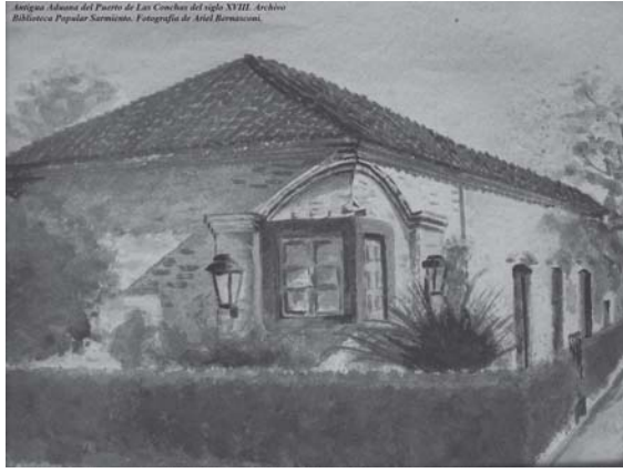
Restos del Puerto de Las Conchas del siglo XVIII.