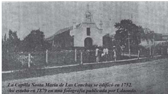
La Capilla Santa María de Las Conchas se edificó en 1752. Así estaba en 1879 en una fotografía publicada por Udaondo.