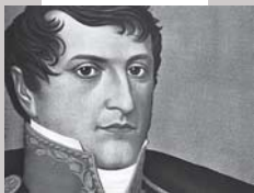
Manuel José Joaquín del Corazón de Jesús Belgrano (3 de junio de 1770 - 20 de junio de 1820) - En 1812 creó la bandera de Argentina en la actual ciudad de Rosario.