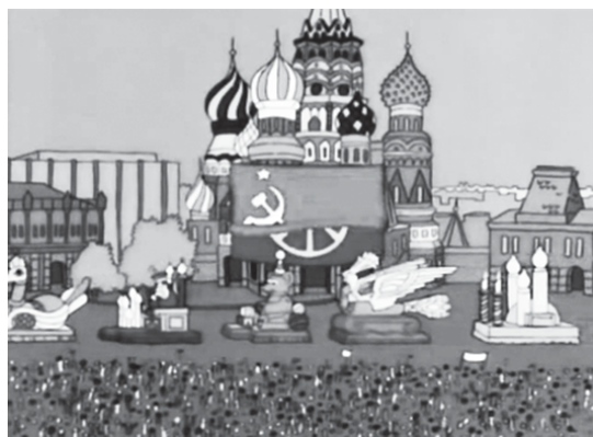
Rusia se presenta como un lugar festivo hasta que se despliega la bandera de la Unión Soviética, y el Ejército Rojo desfila mientras de fondo se escuchan sonidos que expresan sorpresa

El gobierno de la provincia de Buenos Aires, anuncia las nuevas medidas y criterios de definición de fases, en el marco de una nueva etapa de aislamiento (ASPO) y distanciamiento social, preventivo y obligatorio (DSPO), que se extenderá hasta el 2 de agosto. En los 35 municipios que forman parte del área metropolitana (AMBA), se definió una "fase 3 escalonada" del ASPO, caracterizada por la apertura y habilitación de diferentes actividades y rubros en forma paulatina: a partir del lunes 20 de julio se pondrán en marcha todas las industrias manufactureras; en tanto el miércoles 22 del corriente podrán reabrir comercios de cercanía y agencias de juego oficiales; y a partir del 27 se sumarán servicios inmobiliarios y de mudanza, servicios jurídicos, notariales de contaduría y auditoría, atención de profesionales de la salud, servicio de mantenimiento en hogares y de peluquería y estética. Todas las nuevas actividades que se suman a la fase tres escalonada, deberán ser ejercidas bajo estricto protocolo de prevención. Por su parte, los demás distritos bonaerenses, serán encuadrados en el sistema de fases bajo nuevos criterios definidos por la Provincia.