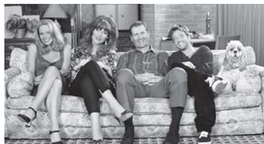
Arriba: Familia "Bundy" y de la serie "Married... with children" Los "Argento" "Casados con hijos", en la foto de tapa

Por: Aldana Villanueva (Ciencias de la Comunicación, UBA) Contacto: aldanavillanuevaav@hotmail.com