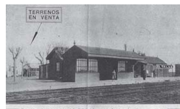
Estación "El Talar" (No. 35 - F.C.C.A.) situada frente a las sierras en venta.

Hoy, la Plaza Hipólito Yrigoyen de El talar, es el punto de encuentro donde nuestra Ciudad se reúne con alegría y diversión, recordándonos así, que siempre que exista una historia vivida en su suelo, nunca dejaremos de ser parte de sus memorias.